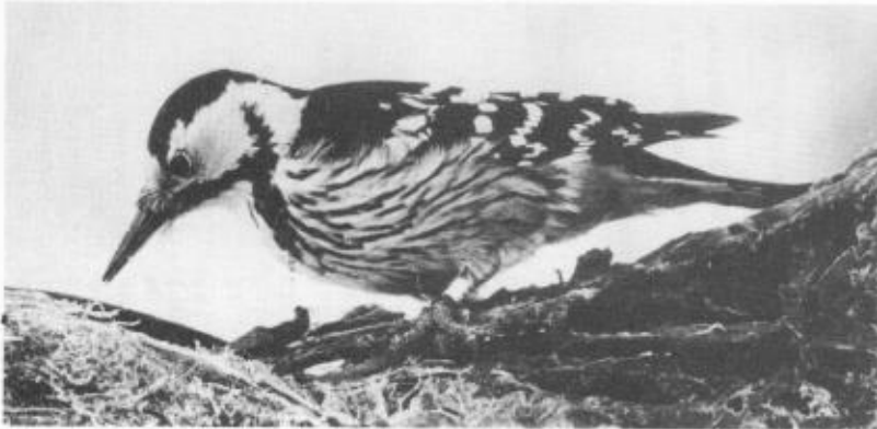
Vitryggig hackspett, hona. Från häckningen i Husby sn.

Nordliga observationer: 2 sj 1-5/7, Grimsöcker, Målungs sn (MHA, BEL). 1 sj juli, Nusnäs, Mora (AP).