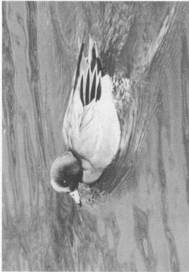
Bläsanden i Faluån.

Endast en häckning rapporterad: 1 hona+4 pull 22/6 Glisstjärn, Rättviks sn (MB,OK,FK).