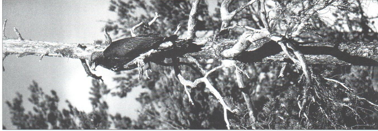
Kungssörn, 2K, Leksand, mars 1997.