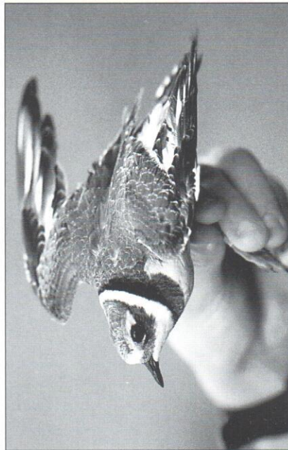
En av de sju större strandpipare som ringmärktes vid Höjtjärn under 1997.