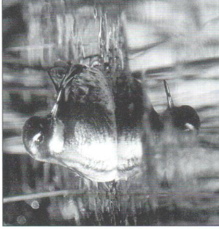
Smalträbbad simsnäppa .

Stora ansamlingar vid Hovran, Hedemora kn: 100 ex 30.4, 150 ex 6.5 Sörbogrundet, 50