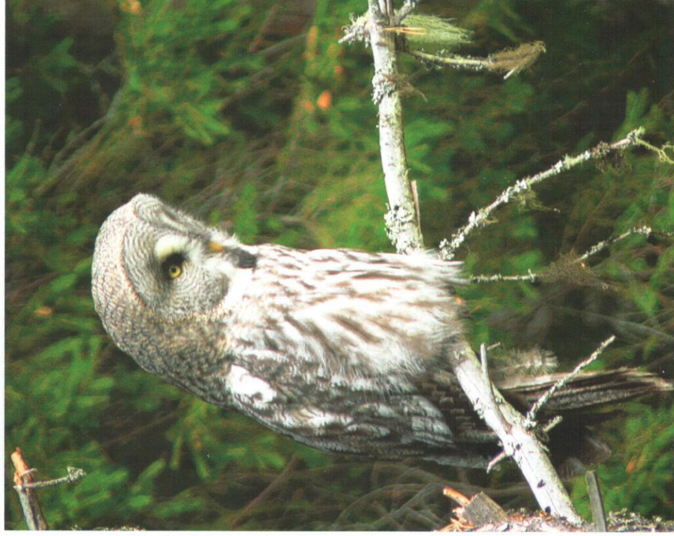
Lappuggla ( Strix nebulosa ).

Ängshök 1 2K Brunna, Hovran, Hedemora 22.6.2006 Storlabb 1 ex Bengtsarvet, Sollerön, Mora 13.6.2006 Kustlabb 1 ex Backabro, Falun 1.5.2006 Kustlabb 1 ex Roxnäs, Falun 8.9.2006 Dubbelbeckasin 3 ex Höjtjärn, Ludvika, Vstm 9.7.2006 (sommarfynd) Berglärka 1 ex Högfjällshotellet, Sälten, Malung 3.8.2006 (sommarfynd) Berglärka 1 ex Tomtebodan, Mora 7.9.2006 (tidigt höstfynd på udda lokal) Entita 1 ex Storsäteren, Grövelsjön, Älvdalen 3.1.2006 (nordligt fynd)