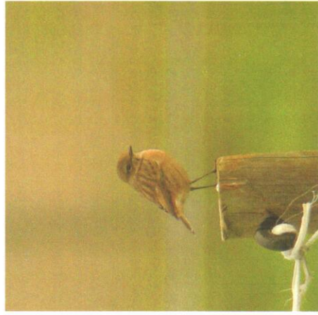
Västlig svarthakad buskqvätta på Sollerrön.