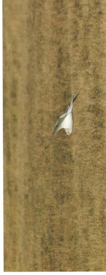
Stäpphöök vid Västerbyhytta i Söderbärke.

Bägge fåglarna var samarbetsvilliga och visade upp sig för ett stort antal tillresta skådare. Första fyndet gjordes 29.5 2004 och nummer två kom 10.4 2005. Kanske proppen har gått ur för stäpphööksfynd i Dalarna nu. De tre första fynden gäller adulta hanar och fågeln i Gagnef var således den första ungfågeln.