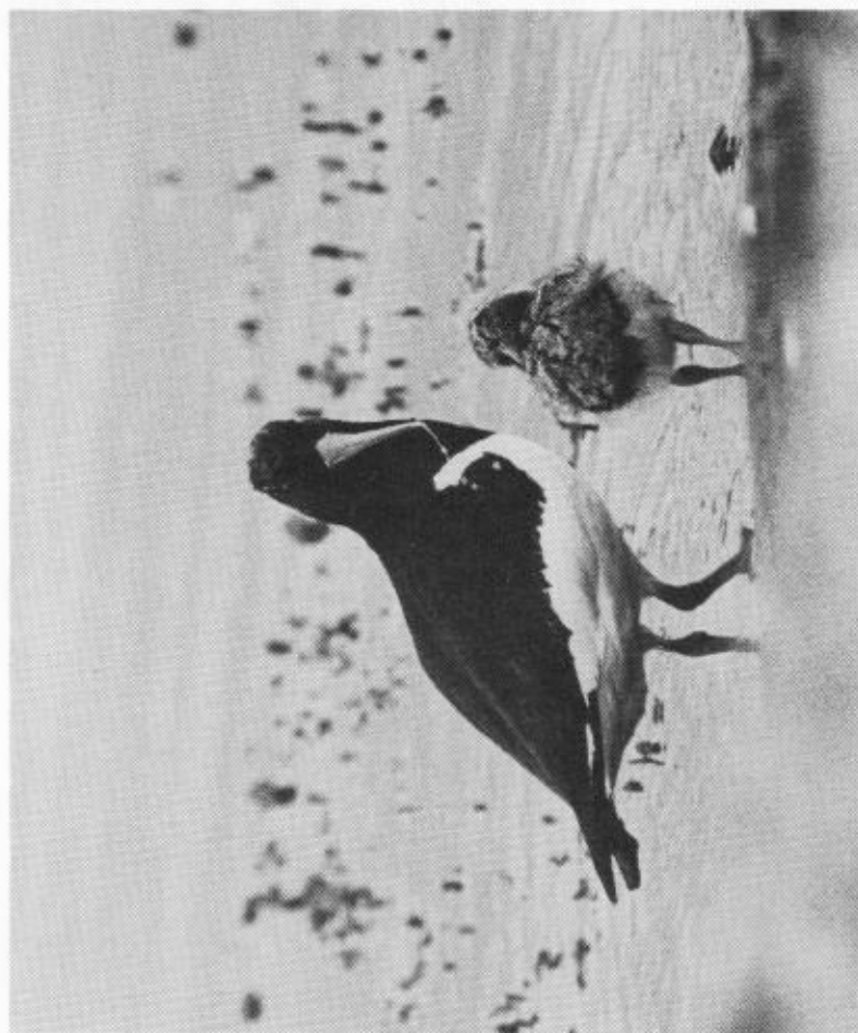
Strandskata med unge.