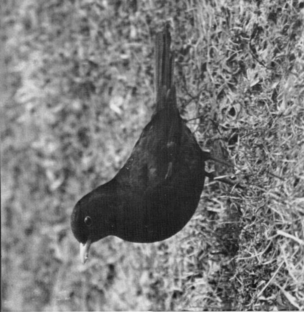
Koltrast hane.

Koltrasten ( Turdus merula ) är egentligen också en typisk skogsfågel, och som sådan trivs arten i lite friskare-frodigare skog; i den torra tallskogen läm- nar han plats för tal- och dubbeltrast. Koltrasten är också vanlig i städer och samhällen liksom björktrasten, och ju längre söderut i landet man kommer, desto mer "urbaniserad" är koltrasten. Som skogsfågel är koltrast-en ganska