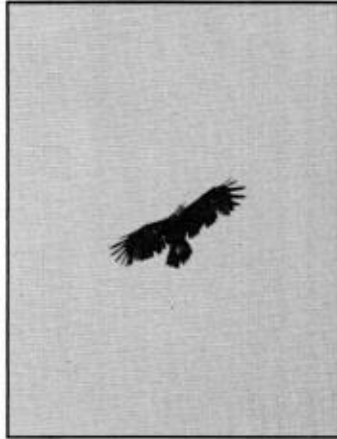
Silhuetten, med den förhållandevis korta 7:e handpennan visar tillsammans med klen näbb och svartbrun bottenfärg att det rör sig om en skrikörn.

örnar fortsätter den till ögats bakkant och ser ut som en lång gul clownmungipa. Den är visserligen inte mer än några millimeter längre än skrikörnarnas, men vilka millimeter! Den har till och med ofta en tendens till att tjockna och "le inners". Skrikörnarnas mungipa slutar under ögat och är rak. Mörkhuvade större skrikörnar kan ha en tydlig mungipa, och man måste notera den exakta utbredningen.