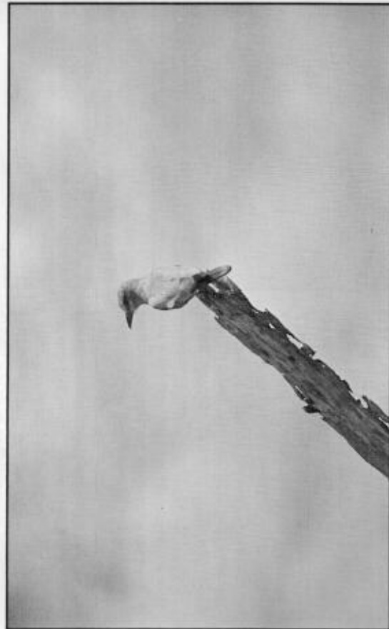
Den blåkråka som sågs sommaren '94 var det första fyndet i Västmanland på 17 år.

De första mer översiktliga uppgifterna om blåkråkans utbredning i Sverige kommer år 1746 där Linné i "Fauna Svecica", nämner arten som förekommande i "Skåne och Småland". Under andra halvan av 1700-talet och tidigt 1800-tal florerar uppgifter