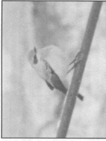
Ovan och under: Medelhavstenskävätta i Bredsjö.