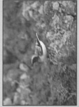
Sveriges första nunnestenskivvätta upptäcktes vid Fläcksjön 1975.

Ett drygt årtionde senare reagerade någon på bilderna som publicerats i Vår Fågelvärld. Var det inte en nunnestenskivvätta egentligen? Fyndet togs upp till ny granskning av rk och med dagens ökade kännedom om skillnaderna mellan de båda närstående arterna, kunde man fastslå; Ja! Det var en nunnestenskivvätta!