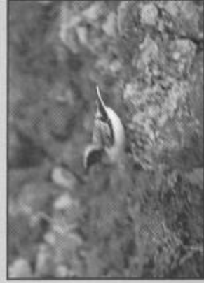
Sveriges första nunnestenskivätta upptäcktes vid Fläcksjön 1975.

Ett drygt årtionde senare reagerade någon på bilderna som publicerats i Vår Fågelvärld. Var det inte en nunnestenskivätta egentligen? Fyndet togs upp till ny granskning av rk och med dagens ökade kännedom om skillnaderna mellan de båda närstående arterna, kunde man fastslå; Ja! Det var en nunnestenskivätta!