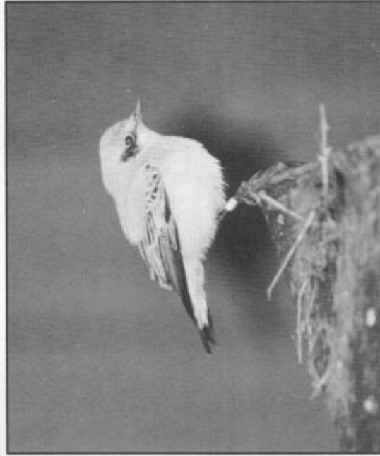
Medelhavstenskivvätta i Bredsjö.

Undersida: mycket ljus men med sandvärgad nyans på sidor. Bröstet,