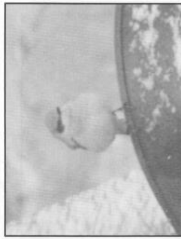
Under: I sex dagar höll medelhavstenskivvättan till på ladugårdsbacken i Bredsjö.