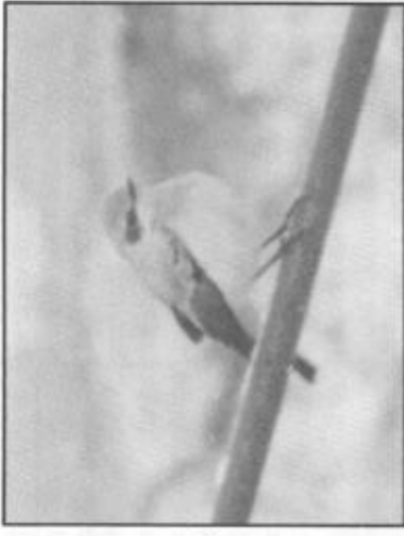
Ovan och under: Medelhavstenskivvätta i Bredsjö.