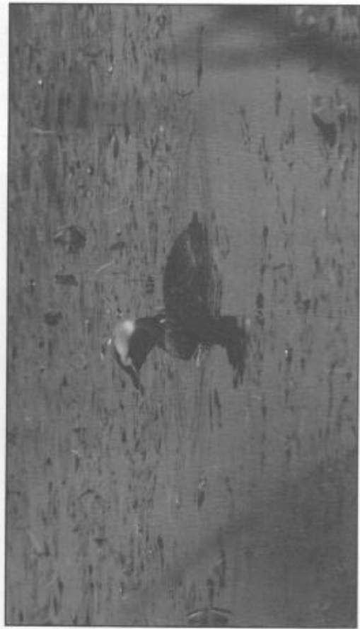
Särlingen i Grylhytteviken.