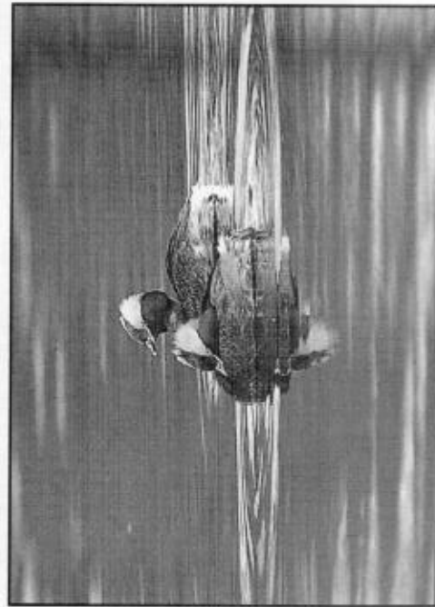
Svarthakedoppingen häckade endast vid ett fåtal lokaler under inventeringsåret 1996.