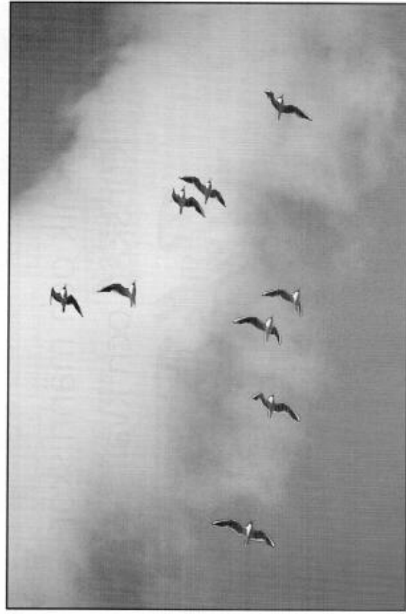
Bland nåsarna är det skrattnåsen som dominerar sträcket vid Sällingesjön.

Nordsträcket om våren verkar inte vara lika koncentrerat som sydsträcket är på hösten, men vissa arter passerar ändå i höga antal. Här följer några exempel på det totala antalet sträckande fåglar från våren: 177 sångsvanar, 16 grågäss, 247 tranor, 205 skrattnåsar och 23 gråtrutar. Även sex