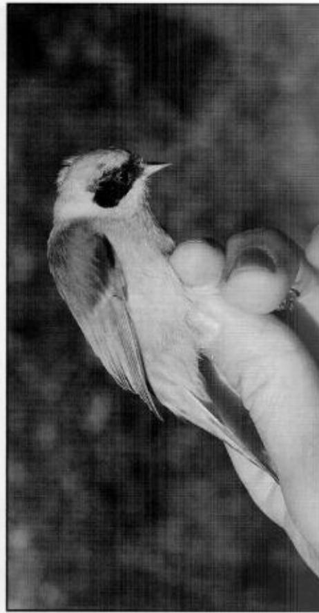
Punges. Ett par häckade i Hässlöområdet, Västerås.