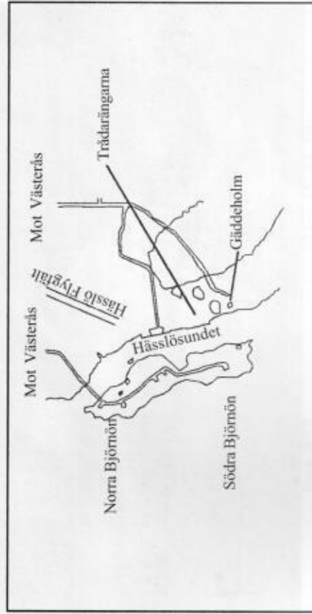
Hässlösundet vid Björnön, Västerås.

Förslaget med att bevara naturstranden vid Hamre är viktig. VOF ser positivt på förslaget från Västerås stads stadsbyggnadskontor i vilket det föreslås att naturstranden bevaras samt att utsiktsplatser rustas upp och en viss