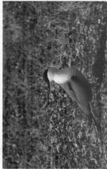
Kommer någon att lyckas se fjälllabb i landskapet under nästa år?