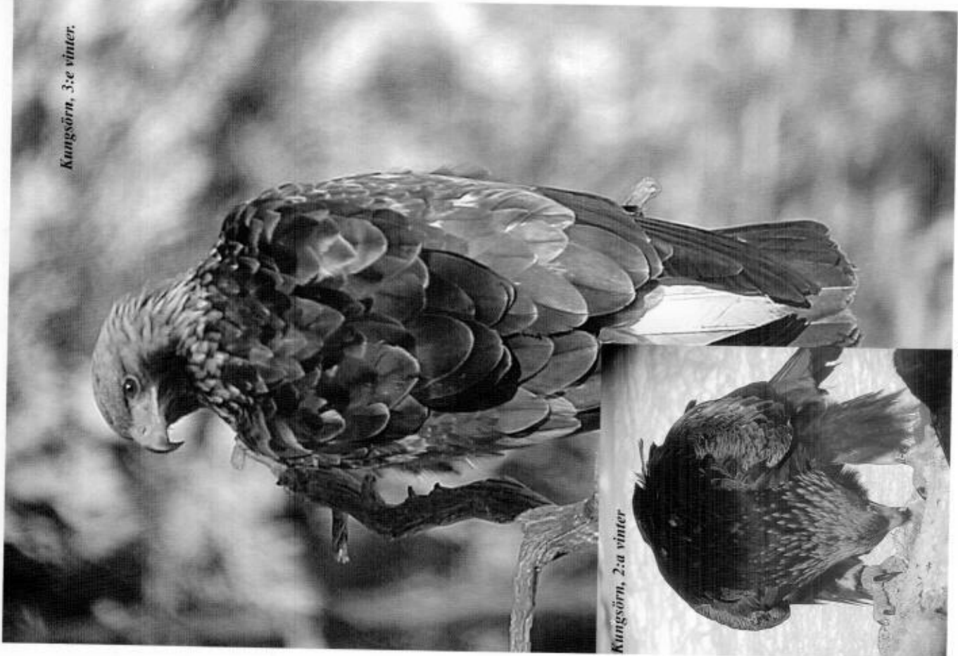
Kungsörn, 3:e vinter.