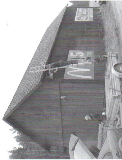
Välkänd lada vid E20.

Som vi berättat om tidigare, fångade vi 2007, i samband med ringmärkning av ungar, in en hona som ringmärktes som boungé i Finland. 2008 återkom samma fågel till samma lada och födde upp en ny kull ungar som ringmärktes. Med spänning ser vi fram emot säsongen 2009. Kommer "vår" fågel tillbaka igen? Är det flera av honorna som kommer tillbaka varje år? Vi ska under kommande säsong försöka att fånga in några flera vuxna fåglar.