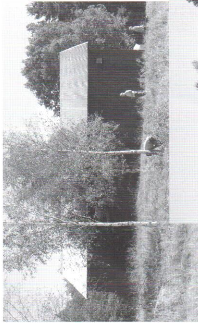
Före och efter röjningen vid Ödesberga.

Som vi berättat om tidigare, fångade vi 2007, i samband med ringmärkning av ungar, in en hona som ringmärktes som boungé i Finland. 2008 återkom samma fågel till samma lada och födde upp en ny kull ungar som ringmärktes. Med spänning ser vi fram emot säsongen 2009. Kommer "vår" fågel tillbaka igen? Är det flera av honorna som kommer tillbaka varje år? Vi ska under kommande säsong försöka att fånga in några flera vuxna fåglar.