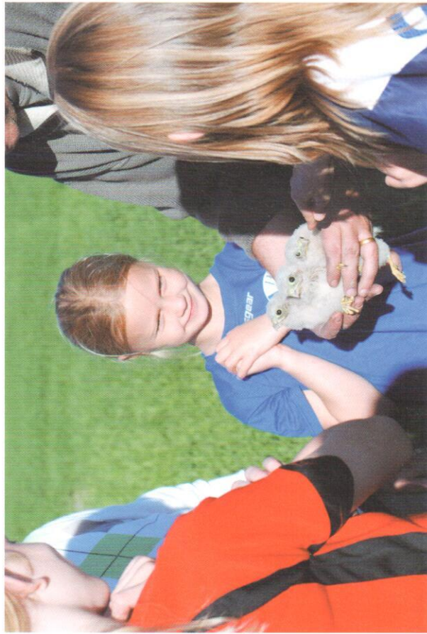
Ett spännande möte. Tornfalkungar och blivande skådare?