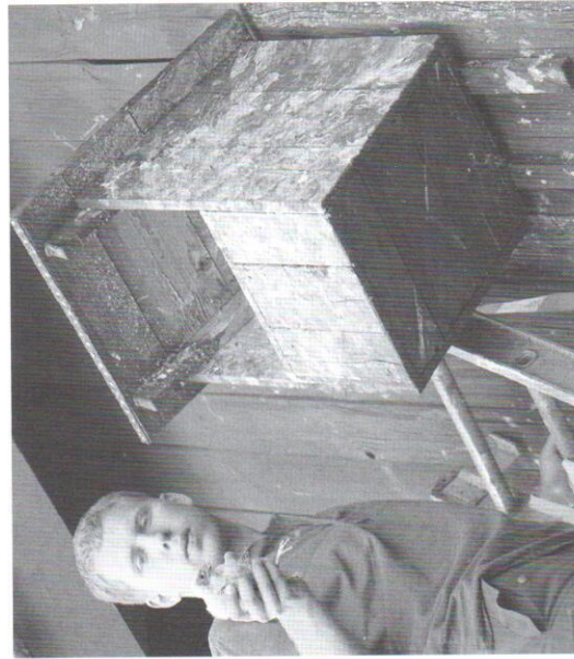
Björktrastar hade försökt bli av med sin oönskade granne genom att attackera holken med spillning. Dock utan framgång. Fyra ungar ringmärktes.

Även 2009 har vi fått ekonomiskt bidrag från Alvins fond, Naturvårdsverket.