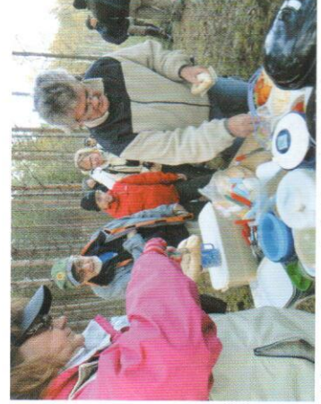
Deltagarna i transafarin lät sig väl smaka av soppa med tilltugg.