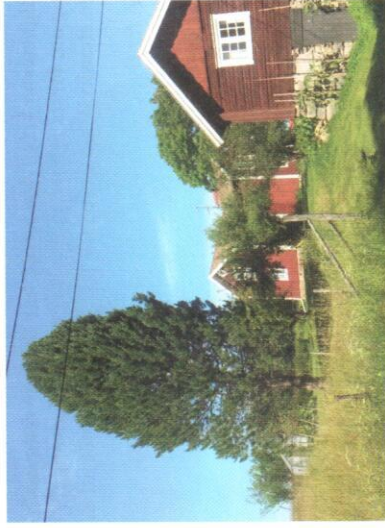
Högt upp i cembratallen, i ett gammalt skatbo, häckade både hornuggla och tornfalk framgångsrikt – fast på olika våningar förstås.

Den 16.4 hörde jag en hornuggla ropa svagt från tallen och någon dag senare stod det klart att det var två. Kanske inte långsökt att tänka sig att samma par från 2017 var tillbaka. Först i början av maj såg jag de första tornfalkarna för året i byn. Jag trodde inte mina ögon när jag den 8.5 såg att tornfalkarna också höll till i samma tall och samma skatbo som hornugglorna! Boet är cirka metern högt, placerat högst upp i tallen, och ugglorna flög in uppträffande, medan falkarna flög rätt in i den nedre delen av boet! Det var intressant att följa utvecklingen när det sedan började