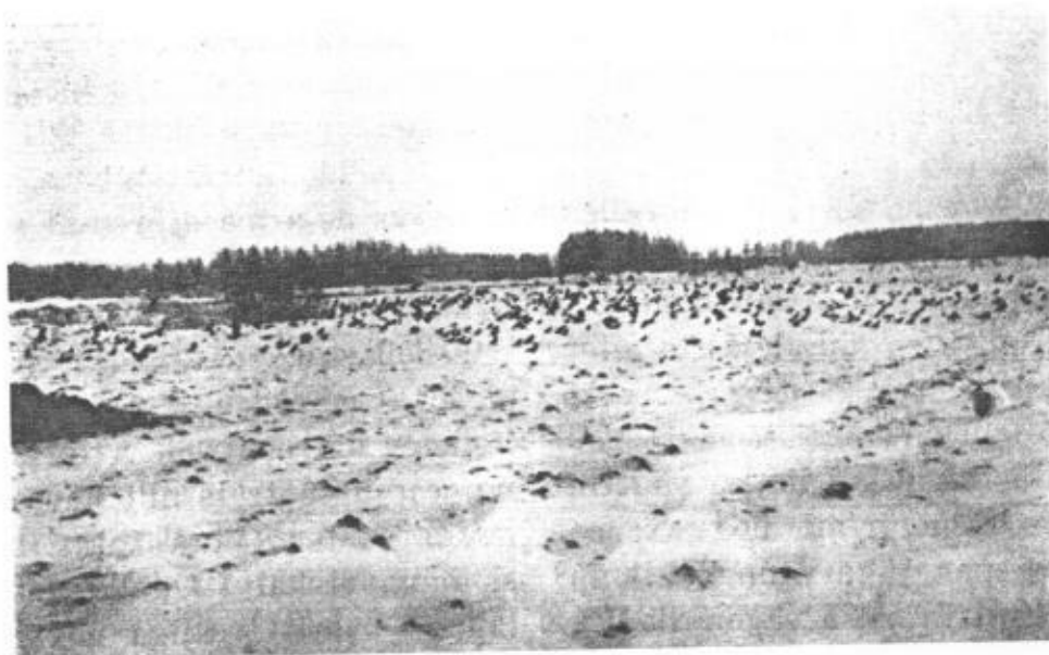
Kräksvärmar utanför Västerås.

rit utsatt för. Skytte på uppsprång har mångenstädes flitigt bedrivits på dessa harar, som i sina djupa snöhålor varit lätta att upptäcka på de släta fälten och också utan svårighet släppt jägarna inom skotthåll, även vid sträng köld. En hel del sådana harar hava även skjutits i trädgårdar, dit de under denna vinter i högre grad än annars sökt sig in för att i fruktträdens bark finna en er-