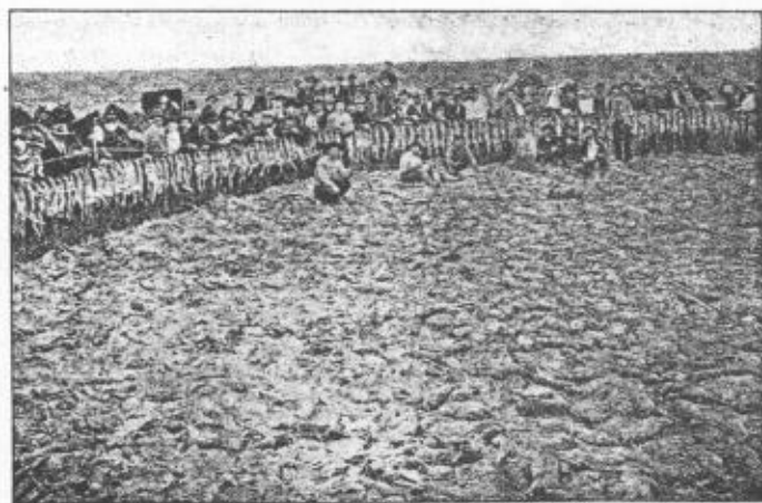
Från den stora harslaktningen i Kalifornien (se föreg. n:r).