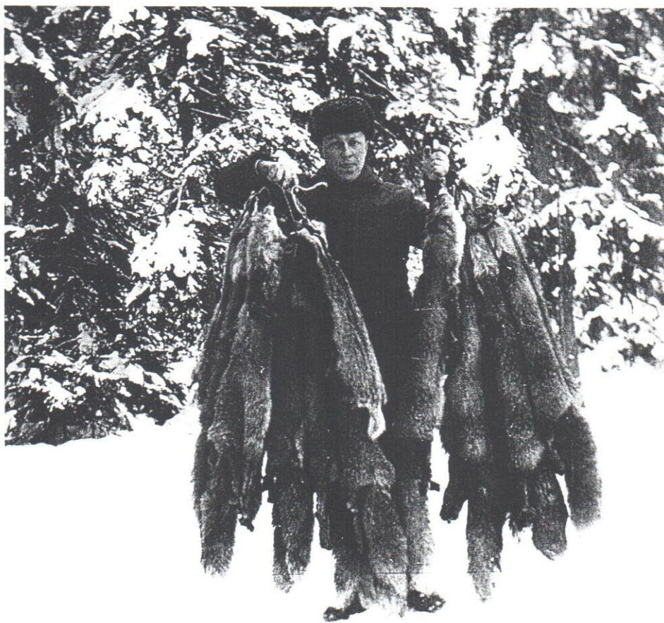
Författaren med 1968 års jaktbyte, tolv fullhåriga rävskins. De flesta skjutna vid rakjakt i månsken.

Kristiden, 1940-45, medförde att "grävlingen, som tidigare i stort sett fått leva i fred i bergslagstrakterna, har nu, sedan hans kött och skinn blivit livligt efterfrågade, fått vidkännas en kraftig åderlätning". Även kråkan ingick då i vårt folkhushåll som en ätlig fågel! 46)