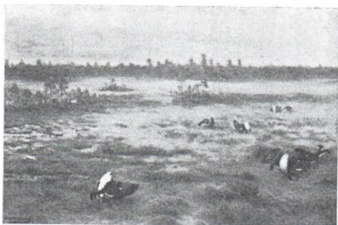
Orrlek på mosse. Oljemålning av Wilh. Bergewing.

upprört alla fågelvänner, att just denna fågel får skjutas, när alla andra fridlyses under sin häckningstid och ostört får bygga sina bon i vårlig familjelycka. Nu har dessbättre skett en förändring och även morkullan har blivit fridlyst.