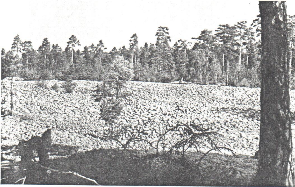
Köpingsåsens fortsättning söder om Kungsör bär ett vida berömt men nu genom stentäkt delvis förstört strandvallsområde, »Stengärdet». 2/9 1956.