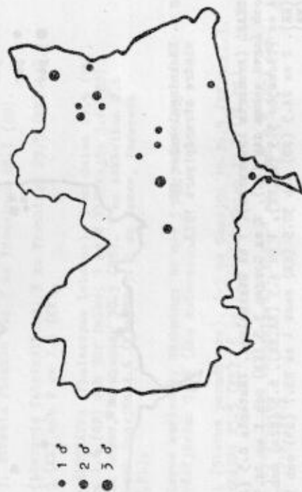
Fig 3. Fyndlokaler för småfläckig sumphöna 1977.

SMÅFLÄCKIG SUMPHÖNA (Porzana porzana). 21 hantar på 14 lokaler (jfr. 1976 22 hantar på 16 lokaler). Fig 3 visar fyndlokalerna 1977.