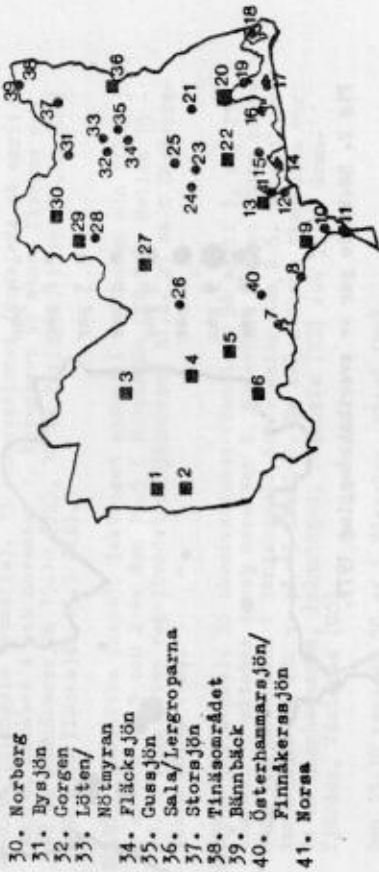
Fig 1. Orienteringskarta över orter och fågellokaler i Västmanland.