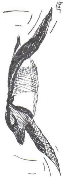
Linnéfågel i vinterdräkt. Teckning: Jan Österberg