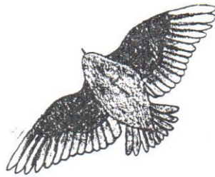
Trädlärlkan framför ofta sin mjuka, vemodiga sång i en sångfyka.

Trädlärlkan lever i skogsmark i södra och mellersta Sverige. Nordgränsen går genom Värmland, Västmanland och Uppland. Men det duger inte med vilken skogsmark som helst. Barr- och blandskog ska det vara, och den får inte vara för tät. Trädlärlkan kan trivas i gles hållmarkstallskog, på tallmoar, hyggen och gamla inägor i barrskogslandskapet. Den vill gärna ha sandig mark och häckar ibland vid större grustag.