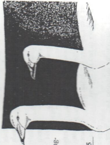
Tabell 1. Lokaler där häckning av sångsvan skett i Lindesbergs kommun

4.11 1994, 114-220 ex Österhammars-sjön 22.10 - 11.11 1994. En anmärkningsvärd vinterflock är också 140 ex Sjömosjön 3.1 1993.