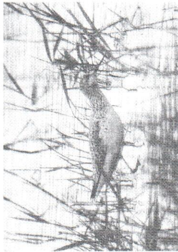
Damshöna Oset 2002-05-01

Kanske har jag med denna artikel lyckats inspirera någon att bli den som har turen och får nöjet att upptäcka en ny art för Lindesbergs kommun. Med ett målinriktat skådande, rätt tid på rätt plats, många timmar ute i fält, fålamod och en gnuttia tur så finns förstås chans. Men fågelskådandet är ju så mycket mer än bara rariteter. Men till det ämnet får jag kanske återkomma till vid ett annat tillfälle, den här gången skulle det handla om morgondagens kommunkruss.