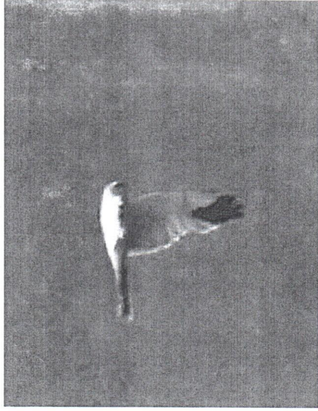
Stäpphök Västvalla 26/6 2007.