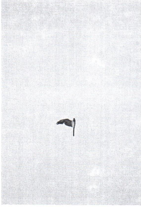
Stäpphök Västvalla 26/6 2007. Foto Johan Wretenberg