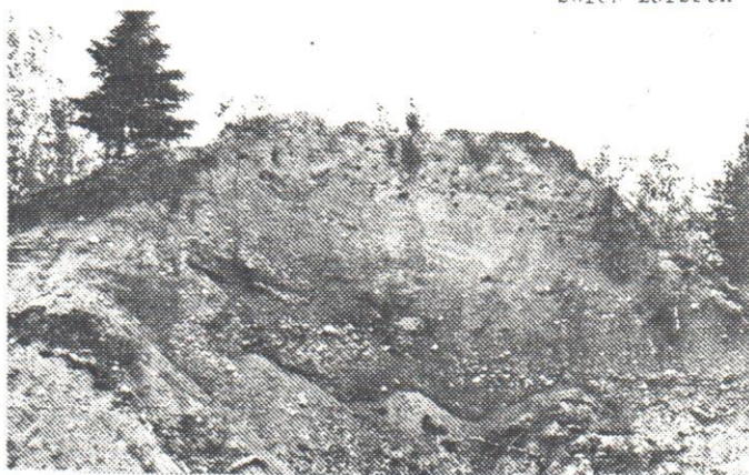
Backsvalekolonin i Seglingsberg.