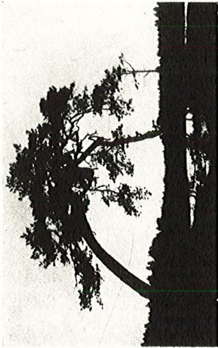
TALL Å HEMMANET KRISTINEBERG GODEGÅRDS S:N, ÖSTERGÖTLAND

Den egendomliga tallen finnes enligt meddelaren i Godegårds socken,