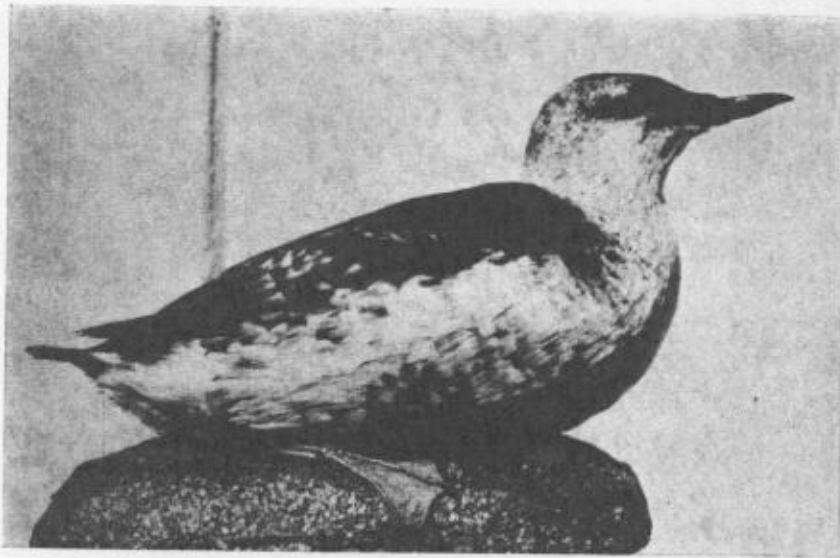
Fig. 2. Tobisgrissla ( Uria grylle ), ♀ i vinterdräkt. Det första i Närke funna exemplaret av arten. (Female black guillemot in winter plumage.)

En alfågel ( Clangula hyemalis ) ♀ tillvaratogs död av herr K. A. ERIKSON vid Slussen i Svartån i Örebro den 31.10.1956. Fågeln var fullständigt utmagrad.