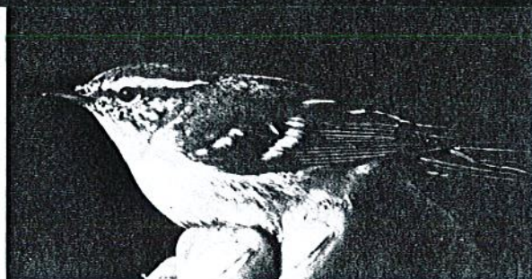
Taigasångare Phylloscopus inornatus fångad vid Hammarö fågelstation, Värmland, 3.10 1975.