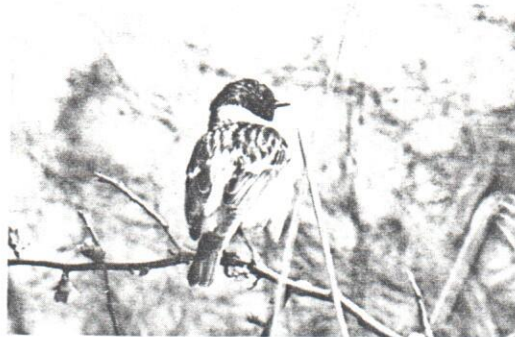
Hane av svarthakad buskskvätta (östlig ras) på Utklippan den 11.5 1981.

Två vårfynd. Endast två av de tidigare totalt 28 fynden utgörs av sådana.