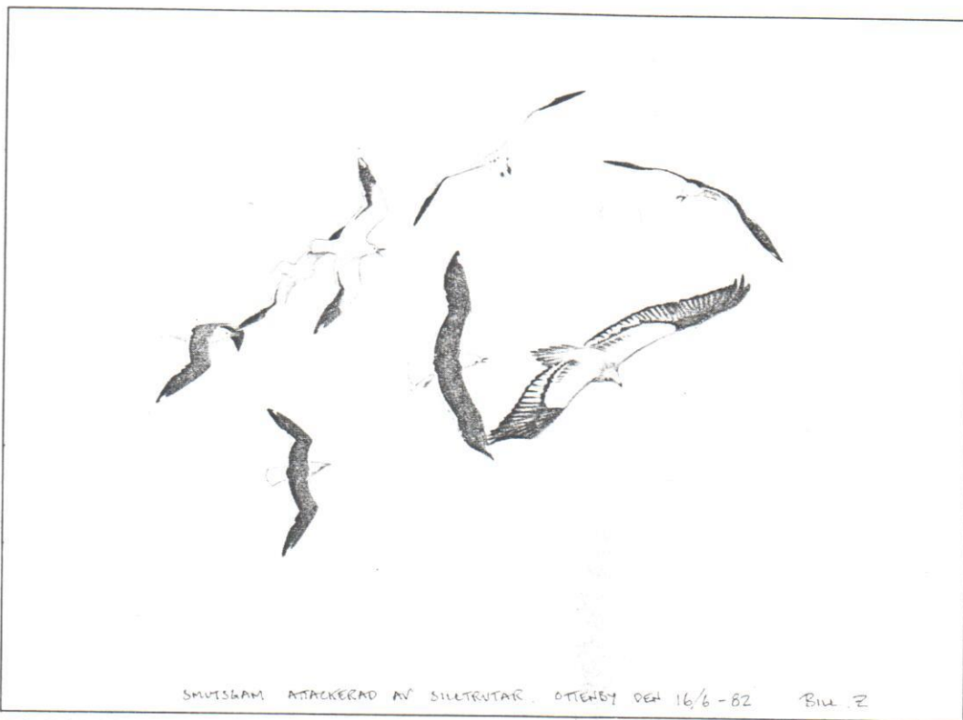
SMUTSGAM. ANTÄCKERAD AV SILLENTAR. OTTENBY DEN 16/6-82. Bill Z

Subadult/adult smutsgam. Teckning: Bill Zetterström.