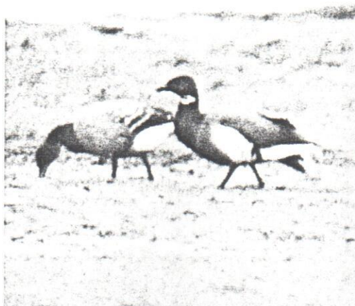
Två regelbundna gäster under senare år: ringand (Karlshamn, jan.—mars 1985) och prutgås av rasen nigricans (Ottenby, 21 oktober 1985). Ring-necked Duck, Brent Goose ( nigricans ).