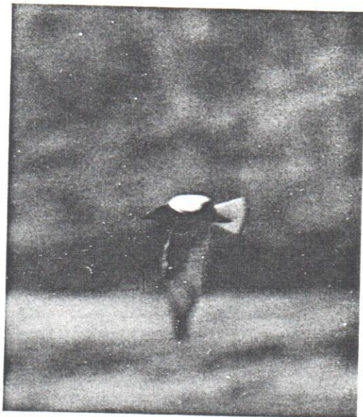
Vitvingad tärna. Eckelsudde, Öland, 20 maj 1985. White-winged Black Tern.

Vstm: 1 ad. Lötén, Västerfärnebo, 22.5 (Åke Berg) och vid närbelägna Fläcksjön 23–27.5 (Håkan Johansson, Karl-Gunnar Källebrink).