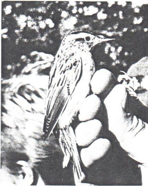
Vattensångare. Fångad vid Falsterbo, släppt vid Kranesjön, hösten 1985. Aquatic Warbler.