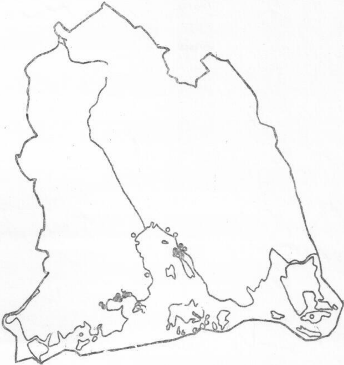
Figur 2. Karta visande fördelningen av rosenfinkar i Västerås kommun 1976. Kartan visar även tecken för möjlig häckning (o), indicier 1-4, och trolig häckning (e), indicier 5-10.