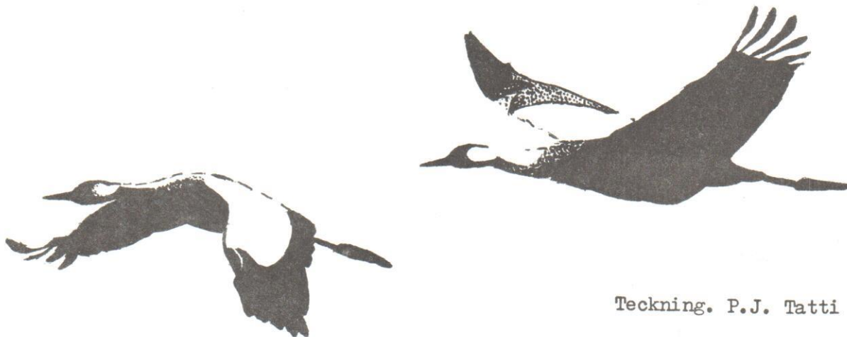
Teckning. P.J. Tatti

Hösten 1980 blev däremot en mycket fin tranhöst, då inte mindre än 483 ex noterades mellan 30.8 och 16.9. Den verkliga toppdagen kom 15.9 då 311 ex sträckte förbi.