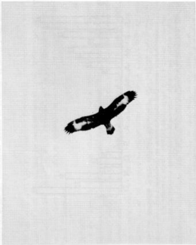
Figur 3. En ung kungsörn vid Ångsö i mälardalen från januari 1969. Vid Ångsö har det under 1960 och 70-talet övervintrat 1-2 unga kungsörnar varje år. Under de senaste åren har ofta även en gammal fågel uppehållit sig där.

Ca 300 par kungsörnar har vi just nu i Sverige. Det visar resultaten av "Projekt Kungsörn". Undersökningarna har utförts av Martin Tjernberg, Uppsala.