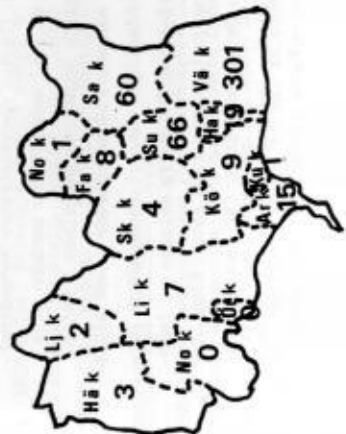
Figur 2. Kartan visar antalet rapporterade fynd av kungsörn fördelade kommunvis i Västmanland åren 1960 - 80. Naturligtvis kan man också läsa ut var de mest besökta fågellockalerna ligger och var de flesta ornitologerna är verksamma.