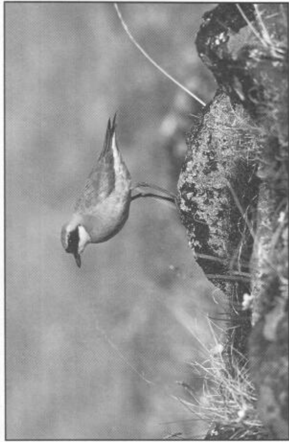
Mongolpipare fotograferad på Tjukterhalvön i östra Sibirien.

ande strandpipare. Vackert tecknad med rostorange bringa. Det röda går vidare upp på hals och nacke (lämnande den bruna