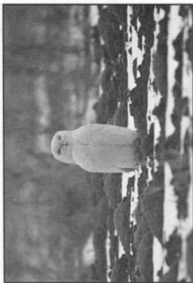
Fjällugglan var en gammal hanne.

två fynd. Sjöarna i Ramnäs (Gläpen och Gnien) tillsammans två och Kumlabby (4 km SV Sala) hade 1 ex vardera två år i rad, vintarna 1961/62 och 62/63.