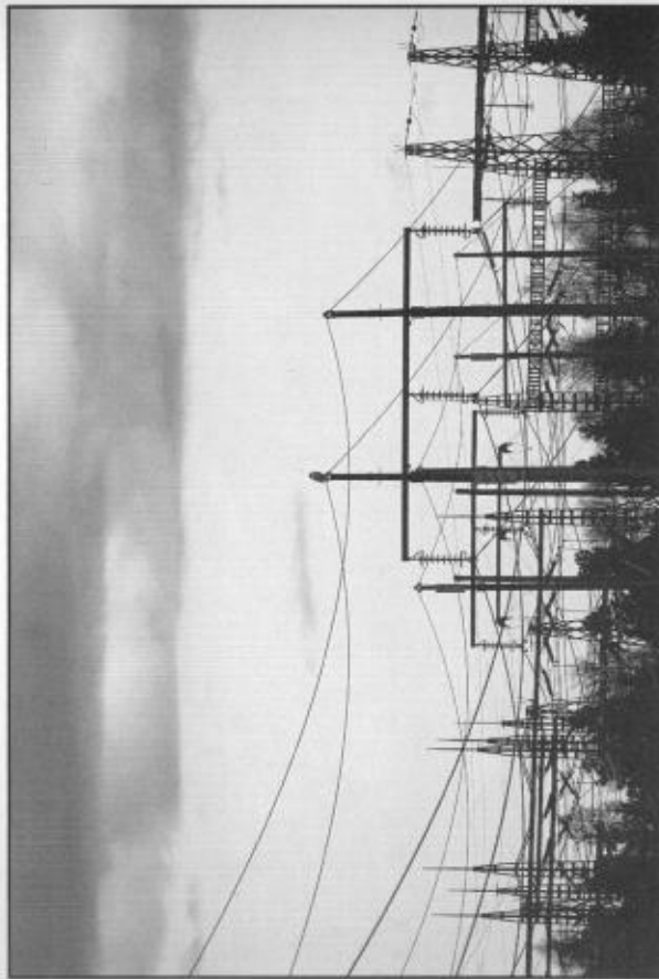
Stora fält, isvidder och sopptippar är platser som fjällugglan föredrar när den strycker runt — men kraftledningslandskapet verkar inte heller avskräcka.

Långstannare (3) saknas inte heller. Uppträddandet av arten är som väntat och känt mycket oregelbundet. Efter att ha saknats helt i många år kan den dyka upp ibland nästan invasionsart. Vintern 1858-59 sägs den ha varit "synnerligen talrik". (Sm, s 15) Eit annat färgstarkt vittnesmål är daterat 1875: "Enligt brukspatron C. G. Löwenhjelms ha några Fjällugglor denna vinter (1875) förekommit i trakten af Nora; till den 1 mars hade två exemplar blifvit skjutna der i nejden. Alla ortens jägare lade an på att få lifvet af dessa ugglor; emedan man kommit under fund dermed att de plockade bort rapphönsen.... En af den ärade Ins:s sagesmän hade en gång under vintern sett två rapphöns flygande taga sin tillflykt till en lada, följda af en hvit uggla (fjälluggla), som derefter satte sig på ladans tak". (SINT 13:100) Vintern 1960-61 uppehöll sig 1 ex "en längre tid" i "Köpings stad". Om möjligen