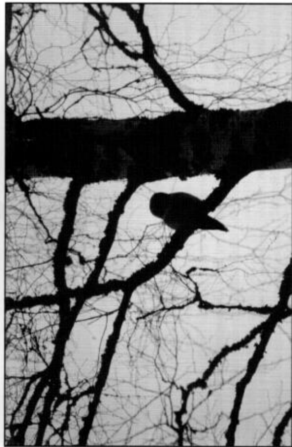
Hökugglan vid Solinge den 14 februari.

Gråtrut underhöll två observatörer under några timmar vid Gryta soptopp 27/12. Bland dem sågs också 1 ad fiskmåls. En har setts återkommande vid Svartån, nedanför Bryggargården i Västerås.