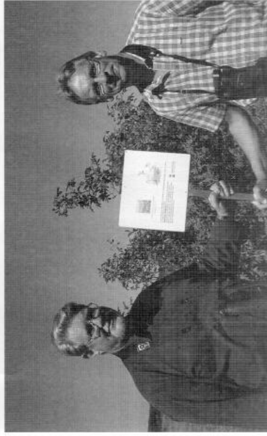
Två Asköviksprofiler på Rastisången.

I Västmanland har vi ett område till och det är Svartaområdet som avsattes 1985 och som omfattar Gorgen, Nötmyran, Fläcksjön och Gausjön. Det området utökades i år med Rörbo-