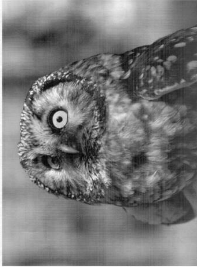
Lockas pärugglan kvar i de områden som holprojekt pågår?.

Resultatet från veckans lyssning skall ses med följande bakgrund. 2002 är andra året i en uppgående gnagarpopulation och att gnagartoppen i innevarande cykel är beräknad att inträffa under 2003. Ugglelyssningen tros ha missgynnats av ojämnt lyssnarväder under veckan, friska vindar och ofta nederbörd i form av regn eller snö. Endast två kvällar, nämligen 17/3 och 24/3, var vädermässigt bra. Huvudlyssnarkvällen den 16/3 blåste det störande i östra delarna av landskapet medan det regnade i västra delarna.