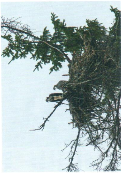
Två fiskgjuseungar som väntar på mat

Detta är naturligtvis till fördel för fiskgjusen. Eftersom linbanan går mellan Köping till sörmäländska Forsby har fågeln flera fiskevatten att hämta föda ifrån som t ex Mälaren, Hjälmararen och Arboga ån.