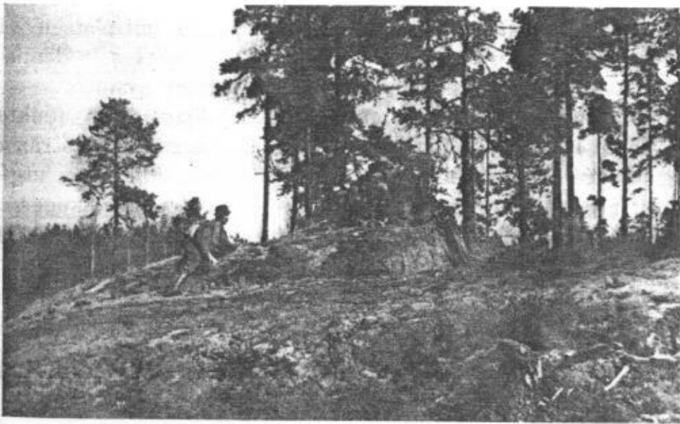
Vid Ringmossröset. Möjligen sköts här Västmanlands sista björn.

Under stämplingsarbete hade skogsvaktaren några dagar tidigare hittat ett bo av nötskrika och i närheten