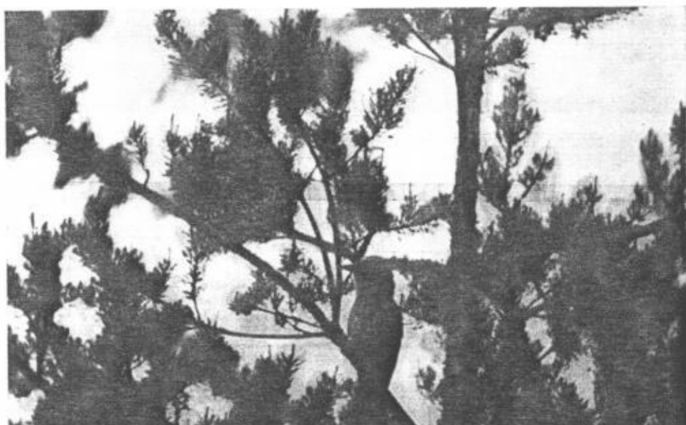
☞ Nötskrikan visade sig ett tag vid boet.