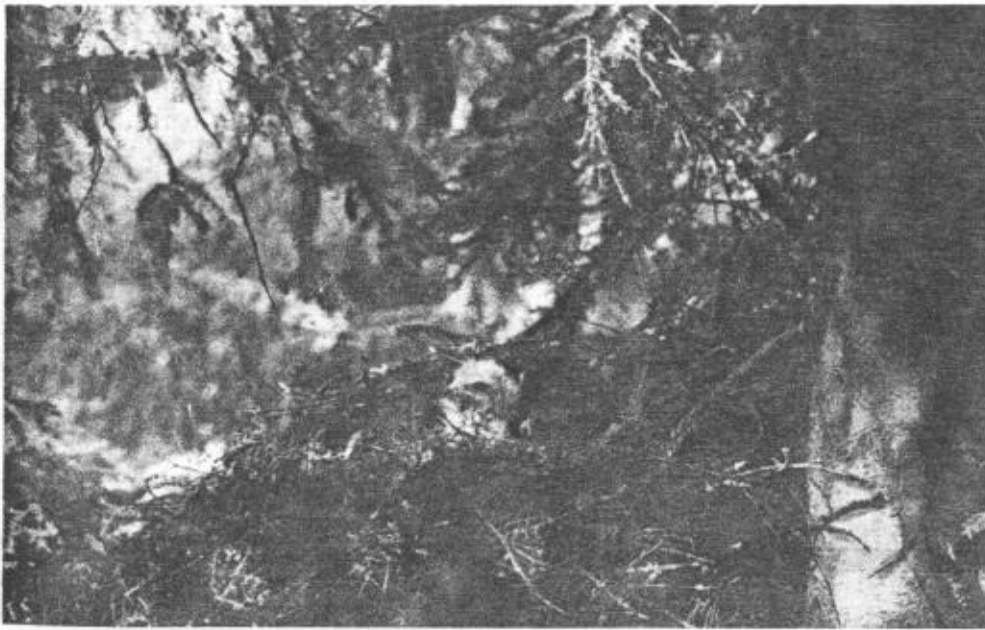
Den halvvuxna ungen.

Bivråken delar med många rovfåglar vanan att draga grönt till boet och har denna vana uppdriven till lidelse. I allmänhet använder han kvistar från lövträd men någon gång även sådana från barrträd. Hane och hona deltaga båda i lövdragningen. De taga vanligen kvistarna från närstående träd, och de bryta av dem med en knyck på huvudet och bära dem i näbben till boet. Genom dag-