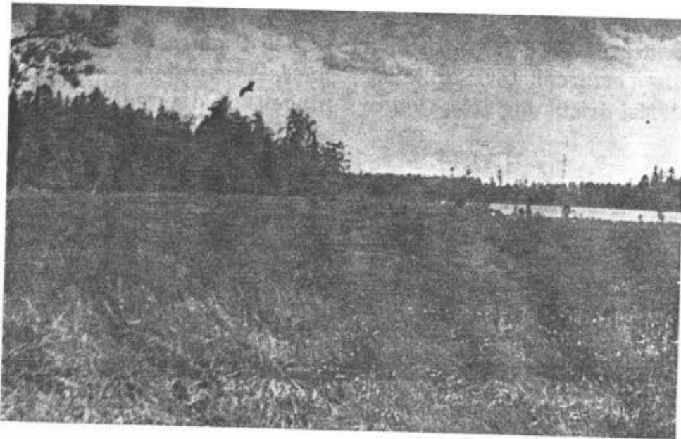
Motiv från sjön Hallaren. Över skogsudden en flygande trana.

bedömt situationen riktigt. Från min plats fick jag det ena tillfället efter det andra på utvuxna flygare, som min pålitlige vorsteh utan undantag med förtjusning hämtade. Då jakten frampå morgonen avslutades på grund av ihållande ösregn, visade det sig, att hela skyttelinjen, trots en mängd avgivna skott, endast kunde uppvisa tre eller fyra fåglar. Mitt byte däremot utgjordes av dussinet