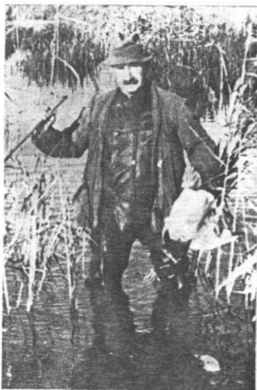
Andjakt i Hjälstaviken. En vacker anddrake bärgas.