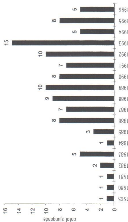
Figur 3. Antalet sjungande kärrsångare i Lindesbergs kommun 1965 - 1996