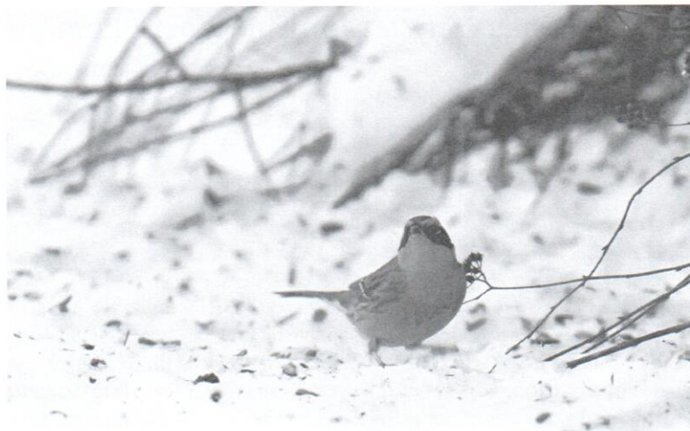
Sibirisk järnsparv Lindesberg 2016-12-18