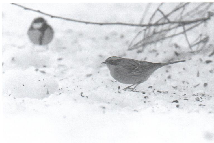
Sibirisk järnsparv Lindesberg 2016-12-18