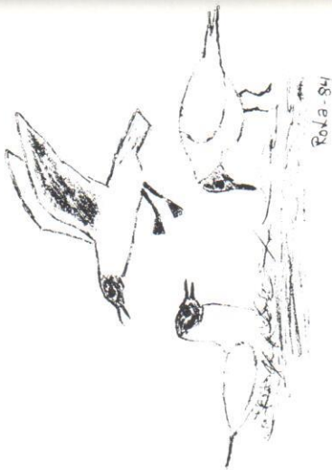
Skrattmåsar vid Skärpan. Teckning: R.Lager

I flera år noterade jag att det producerades väldigt få ungar i kolonin. Då jag 1982 höll kolonin under extra uppsikt, fann jag snart en tänkbar anledning. Ett kråkrpar från Hagen-sidan anlände med jämna mellanrum till kolonin och lämnade den alltid med ägg i näbben. Jag upptäckte att kråkrparna hade stor hjälp av de träd (klibbalarna) som växte på ön. I dessa kunde de sitta och vänta på lämpligt tillfälle att dyka ner